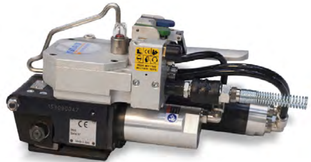
POLI HT 25-32