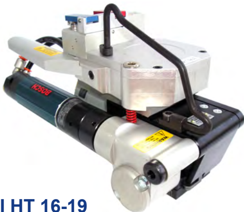
POLI HT 16-19